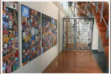
'n Gang in die hof met kunswerke deur Siphon Ndlovu, "Images of South African History" (1998), en sekuriteitshekke wat deur kunstenaars ontwerp is.